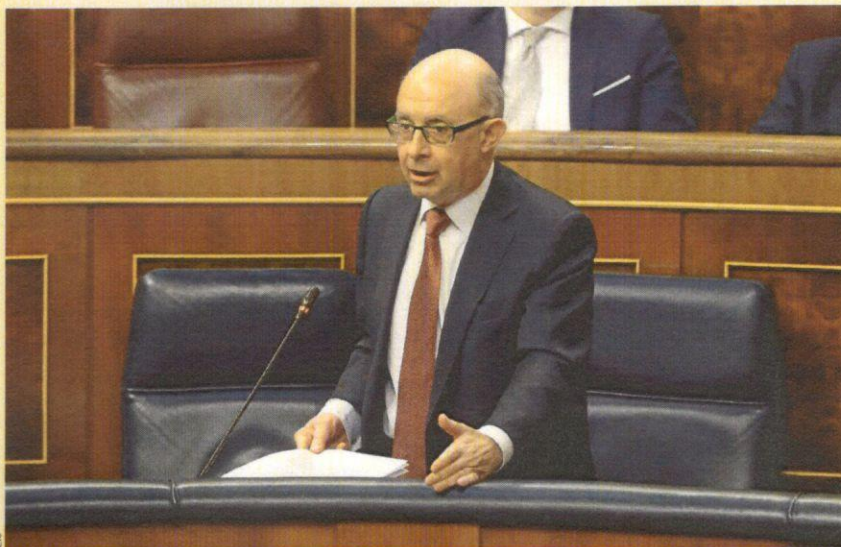
Cristóbal Montoro, ministro de Hacienda y Función Pública, en el Congreso.

Según explicaron en 2016 representantes del Gobierno a los responsables de la patronal del sector, Ascri, la no inclusión del capital riesgo entre los excluidos del pago a cuenta de Sociedades fue "una incidencia regulatoria". Se comprometieron a ponerle